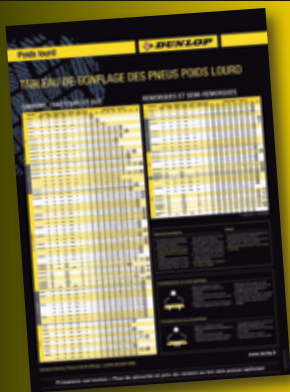
Support de vente